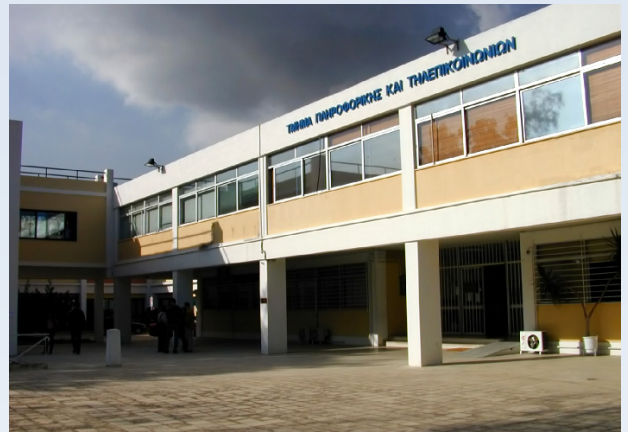
Το Τμήμα Πληροφορικής και Τηλεπικοινωνιών του Πανεπιστημίου Αθηνών

Οι ψηφοφόροι θα πρέπει να έχουν μαζί τους αστυνομική ταυτότητα ή διαβατήριο. Το ψηφοδέλτιο θα είναι ενιαίο για όλους τους υποψηφίους και θα χωρίζεται σε δύο ξεχωριστές ενότητες, με τους υποψηφίους για το Δ.Σ. και την Ε.Ε. αντίστοιχα. Ο αναλυτικός εκλογικός κανονισμός υπάρχει εδώ: http://alumniclub.di.uoa.gr/files/eklkan2009.pdf